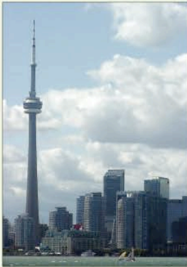
...ou le modernisme de Toronto : deux voyages proposés par Salaün.

lors de ce voyage « minéral ». Un programme Pologne/Ukraine sur 15 jours combiera ceux qui ont soif de culture des pays de l'Est. Enfin, côté soleil, l'Espagne, les Açores sont encore là et bien là.