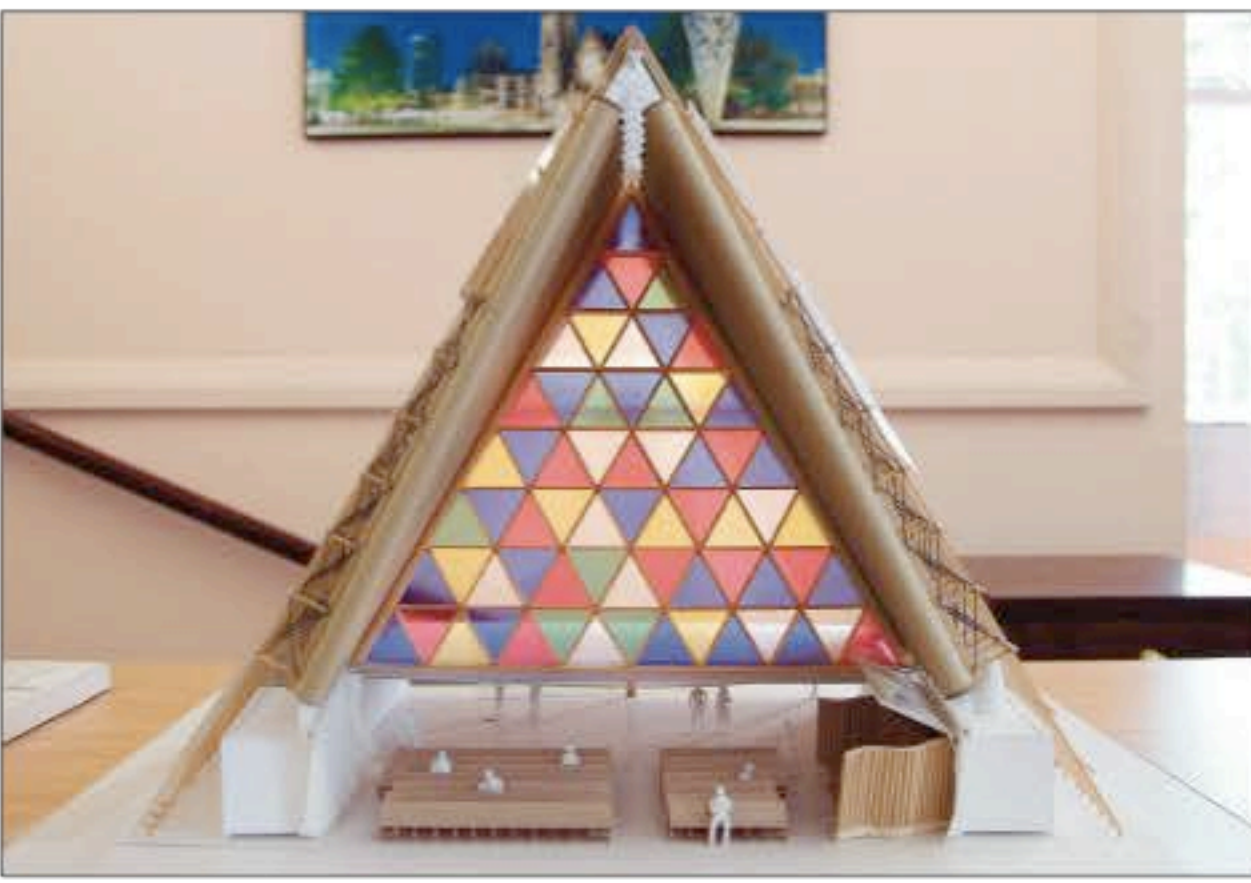
Au lendemain d'une catastrophe, le carton est un matériau immédiatement disponible... et durable.