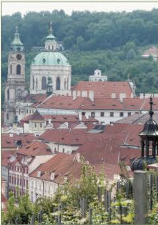
La beauté baroque de Prague...

Les vacances et les voyages, c'est aussi la proximité de l'Europe. Salaün propose de partir à la découverte de l'ex-Yougoslavie pour y découvrir