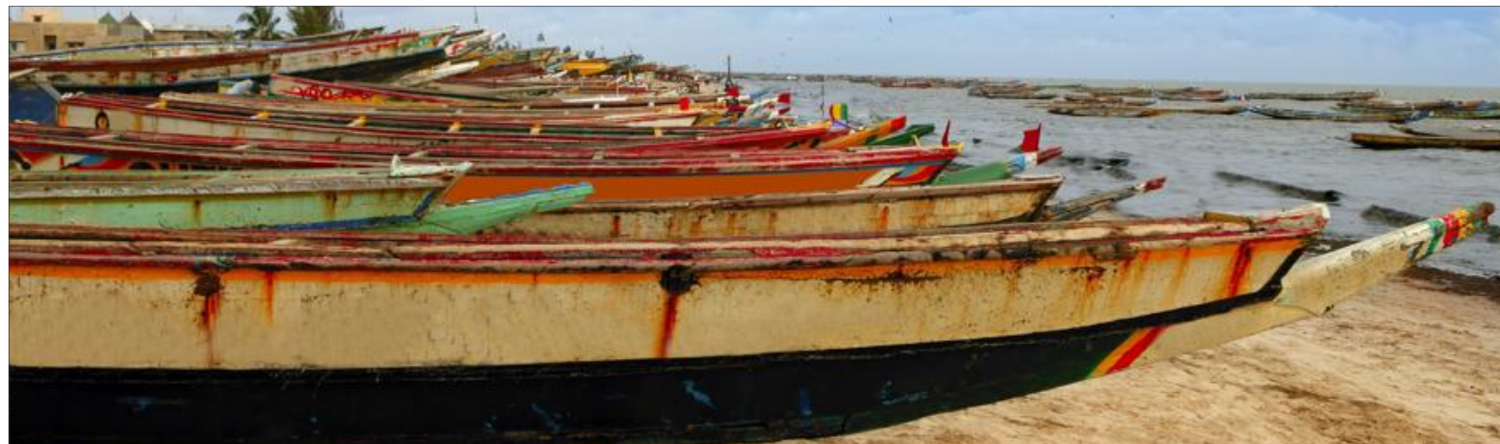
Sur les deux rives du fleuve Sénégal, les pirogues attendent qu'un pêcheur ou qu'un voyageur embarque pour une nouvelle aventure.