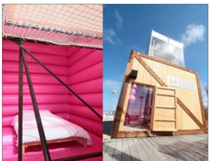
De l'extérieur, la Folie évoque une caisse en bois. L'intérieur, rose et capitonné, ne ressemble pour sa part à rien de connu.

Réservations: 08 26 88 78 87 ou www.saint-jean-de-monts.com