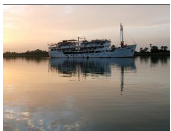
Le Bou el Mogdad vous propose des croisières au rythme du fleuve Sénégal et à la rencontre de ses habitants.